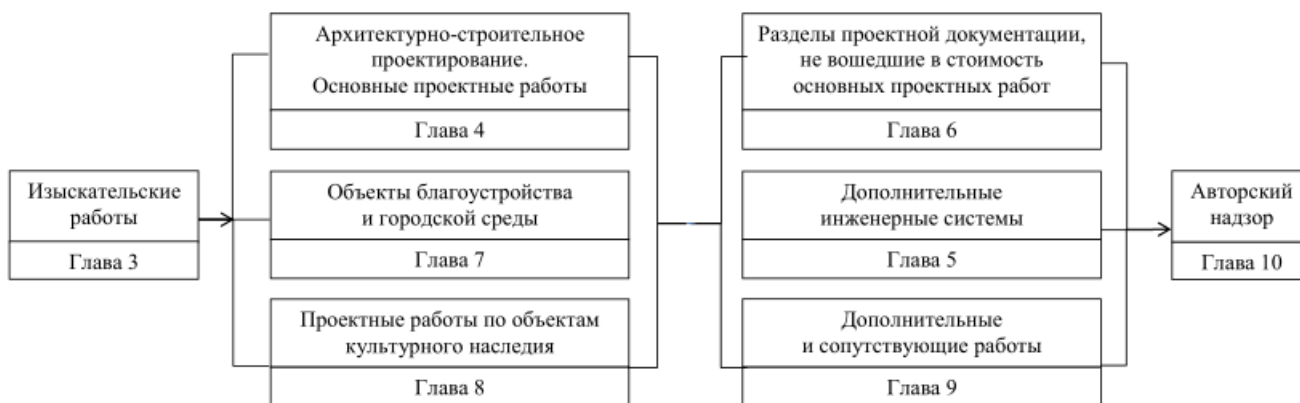
Схема составления сметы на проектные работы по зданию с использованием сборников МРР (справочная)